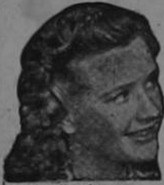
Priscilla Lane de la Warner Bros

DE VENTA EN TODAS LAS BOTICAS Y DROGUERIAS