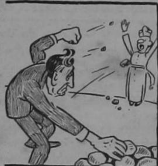
AYER: —De Costa Rica debemos echar a todos los curas. A orgullo tengo ser masón... HOY: —Acúsome, Padre...