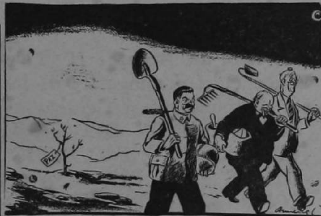
La simiente de la victoria