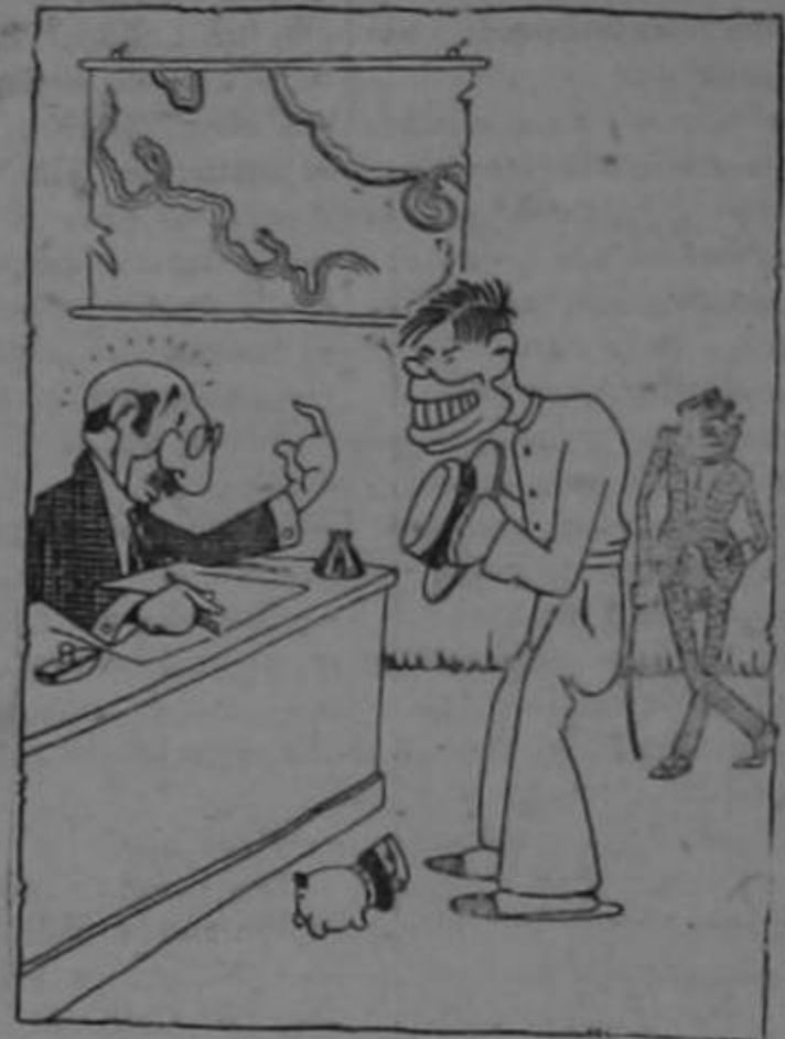
(En un club Cortesista)