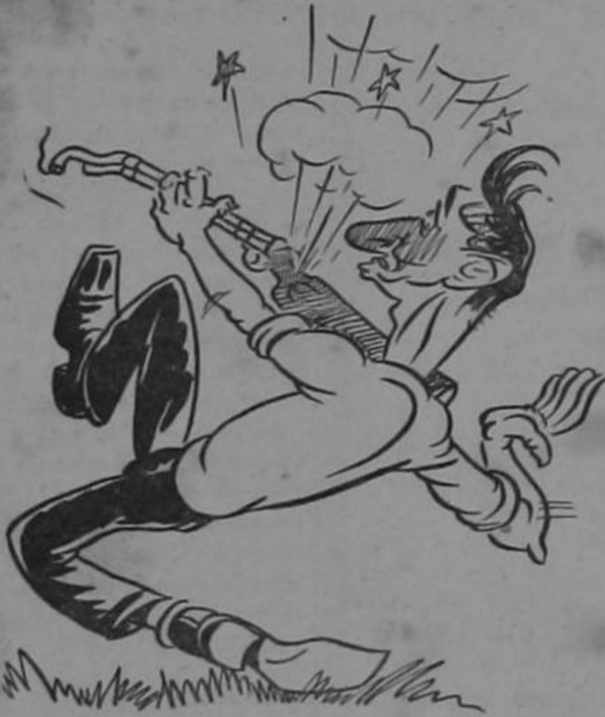
De esta vez le salió el tiro por la culata, ¡Pobre don León, ya no tiene Cura...!